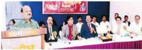
वाशीम : सांस्कृतिक मेळाव्यात बोलताना मान्यवर.