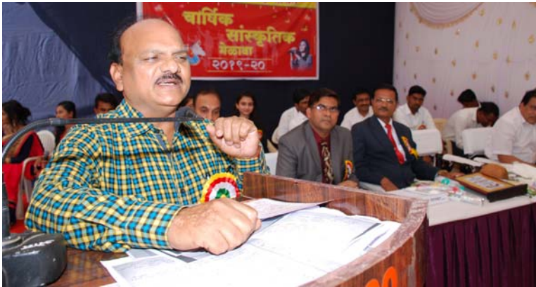
प्रमुख अतिथी विद्यार्थ्यांचे मार्गदर्शन करतांना