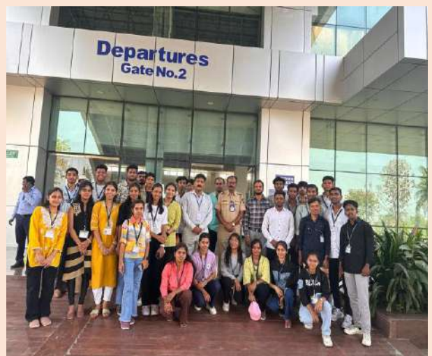
अणुविद्युत अभियांत्रिकी विभागाची श्री. गुरु गोविंद सिंहजी विमानतळ नांदेड येथे औद्योगिक भेट.