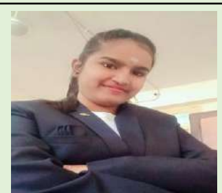
कु. समिक्षा दि. मठपती विद्यार्थिनी प्रतिनिधी (LR)