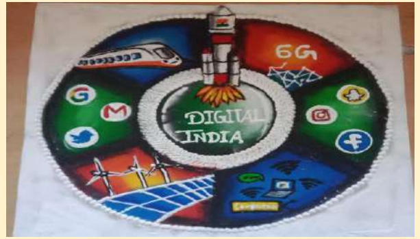
कु. दिव्या लदानकर (CE-4K)