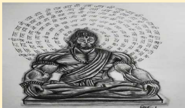
कु. दिव्या लदानकर (CE-4K)