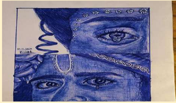
कु. दिव्या लदानकर (CE-4K)