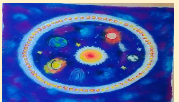
कु. स्थापना आगरकर (IF-6I)