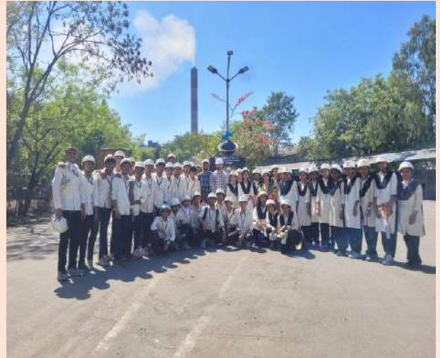
विद्युत अभियांत्रिकी विभागाची पारस औष्णिक वीज केंद्र येथे औद्योगिक भेट.