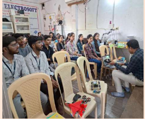
माहिती व तंत्रज्ञान विभागाची MDB Electrosoft, Amravati येथे औद्योगिक भेट.