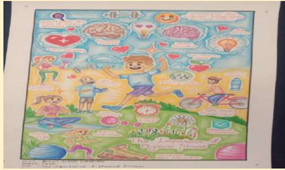
कु. दिव्या लदानकर (CE-4K)