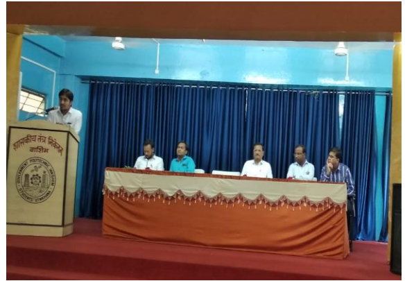
INDUSTRIAL SAFETY PROGRAM ON DT. 05/04/2019