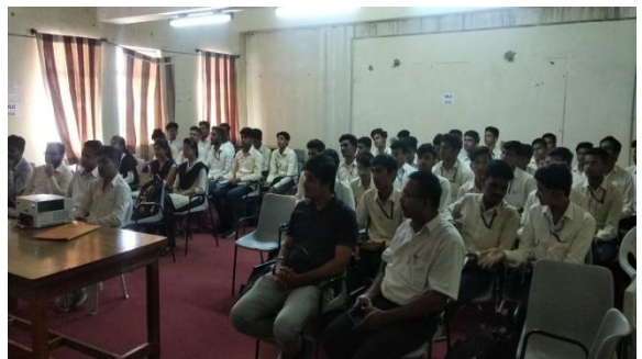
INDUSTRIAL TRAINING ORAL 2018-19