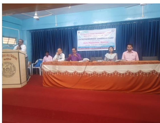
THREE DAYS EAC CAMP 2022-2023