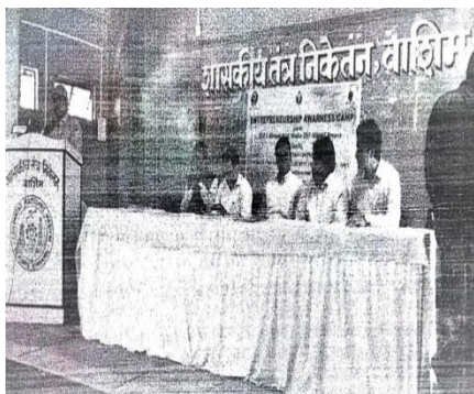
EAC CAMP 2016-2017