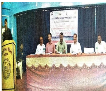
EAC CAMP 2018-2019