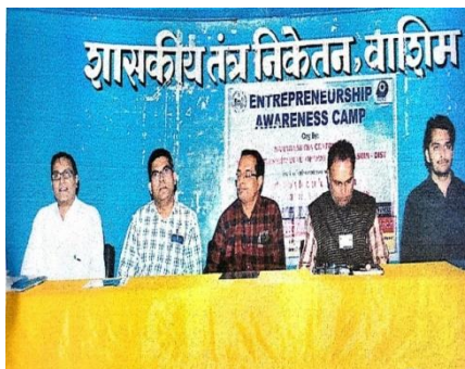
EAC CAMP 2017-2018