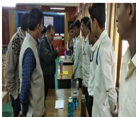
BEST OUT OF WASTE EXHIBITION