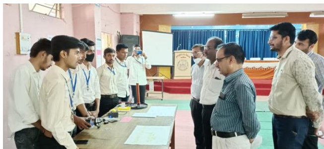
BEST OUT OF WASTE EXHIBITION ON 23/03/2022