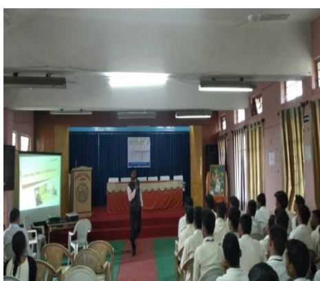
INTERVIEW TECHNIQUES WORKSHOP