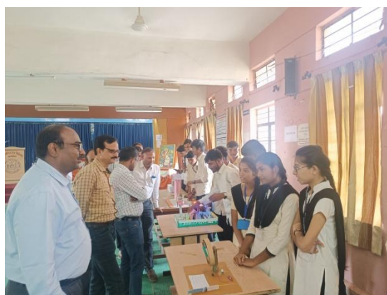
BEST OUT OF WASTE EXHIBITION ON 29/04/2023